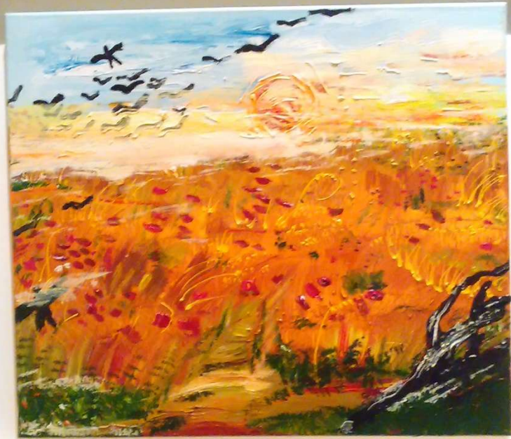
Small white informational card with text, partially illegible.